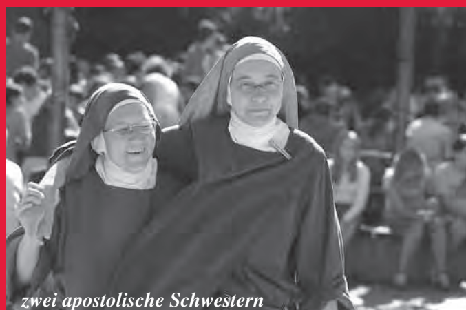
zwei apostolische Schwestern