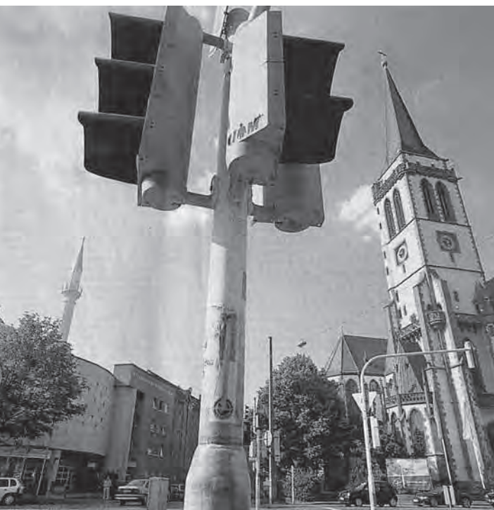
Stadtbild in Deutschland: Minarett und Kirchturm. Die Schweizer haben dafür auf Rot geschaltet.

Die Sicht der Dinge oder der letzten Wirklichkeit, die Gottesbilder, haben aber noch weitere Unstimmigkeiten. Der im Koran sich offenbarende Allah, der übrigens als Götze schon lange vor Mohammed mit anderen Götzen, wie der Schicksalsgöttin Manat, der Muttergöttheit Ilat und der Liebesgöttin Uzza, an der Kaaba verehrt und angebetet wurde, verbreitet Angst und Schrecken unter seinen Geschöpfen und verweigert etlichen von ihnen die Freiheit, sich zum Guten zu bekehren, indem er ihnen den freien Willen entzieht: „Wen Allah leitet, der ist wohl geleitet; wen er aber in die Irre führt, der gehört zu den Verlorenen. Wohl haben Wir (Allah) viele von den Geistern und