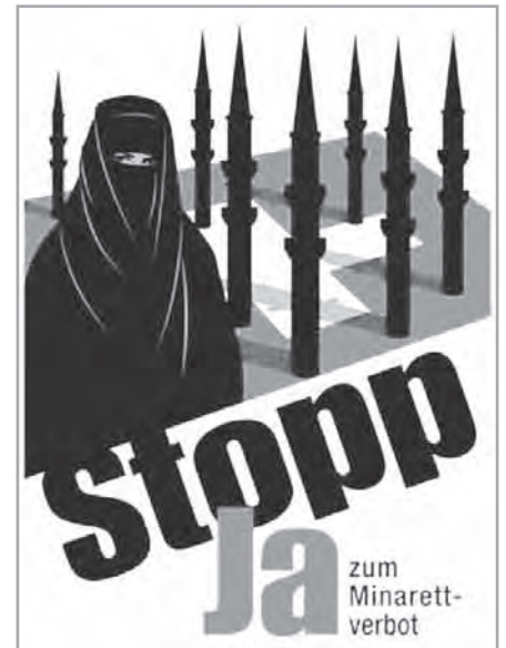
Erfolgreiche Kampagne: Mit diesem Plakat warben die Initiatoren für ein Minarettverbot.

Sichtbarster Ausdruck des aktuellen Streits um die Identität und damit die religiöse Grundierung war und ist der Streit um das Schweizer Votum über