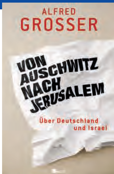
Alfred Grosser: Von Auschwitz nach Jerusalem. Über Deutschland und Israel , Reinbek 2009, 204 Seiten, ISBN 978 3 498 02515 1. Euro 16.90; (A: Euro 17.40).

Auf die Frage, was er denn sei: Philosoph, Soziologe, Politologe, Theologe oder Historiker antwortete der Autor anlässlich eines Kolloquiums: „Moralpädagoge“.