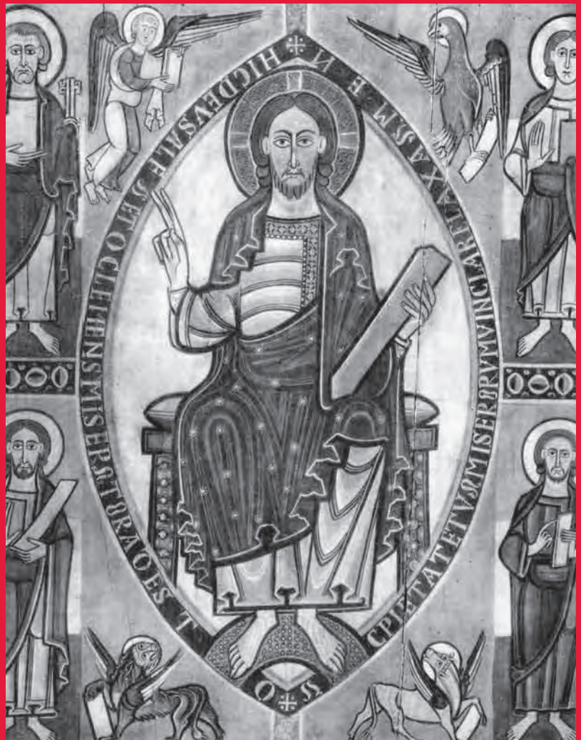
Jesus Christus, der Allherrscher, der „König der Könige und Herr der Herren“ (vgl. Offb 17,14 u. 19, 16). Katalanisch, 12. Jhdt.

„Ein Haus voll Glorie schauet – weit über alle Land – aus ew'gem Stein erbauet – von Gottes Meisterhand... .“