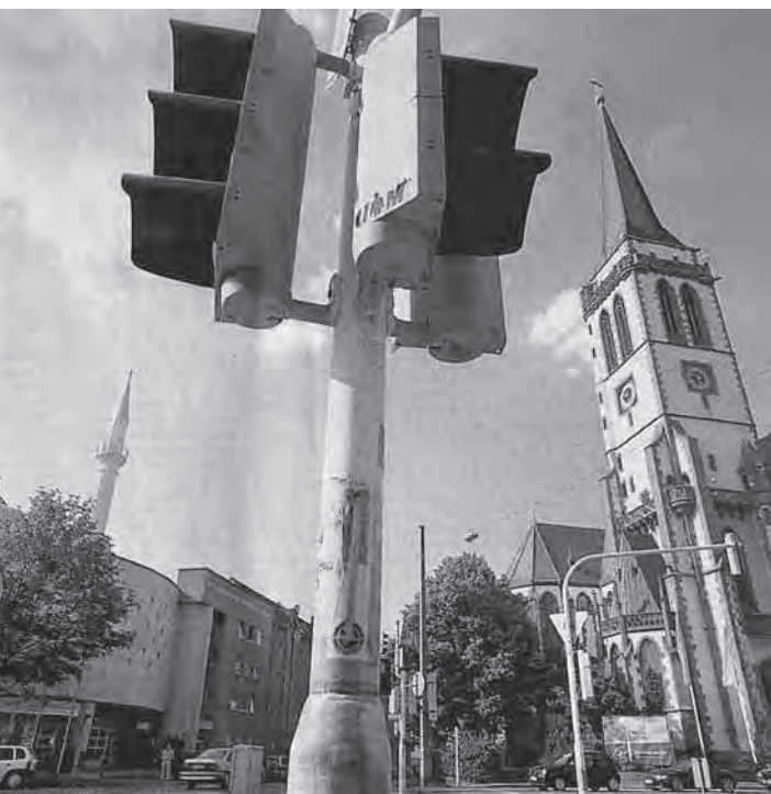
Stadtbild in Deutschland: Minarett und Kirchturm. Die Schweizer haben dafür auf Rot geschaltet.

Die Sicht der Dinge oder der letzten Wirklichkeit, die Gottesbilder, haben aber noch weitere Unstimmigkeiten. Der im Koran sich offenbarende Allah, der übrigens als Götze schon lange vor Mohammed mit anderen Götzen, wie der Schicksalsgöttin Manat, der Muttergöttheit Ilat und der Liebesgöttin Uzza, an der Kaaba verehrt und angebetet wurde, verbreitet Angst und Schrecken unter seinen Geschöpfen und verweigert etlichen von ihnen die Freiheit, sich zum Guten zu bekehren, indem er ihnen den freien Willen entzieht: „Wen Allah leitet, der ist wohl geleitet; wen er aber in die Irre führt, der gehört zu den Verlorenen. Wohl haben Wir (Allah) viele von den Geistern und