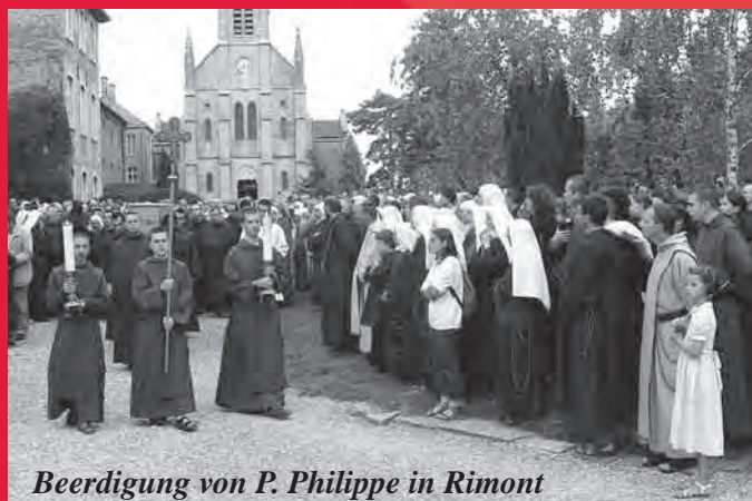
Beerdigung von P. Philippe in Rimont