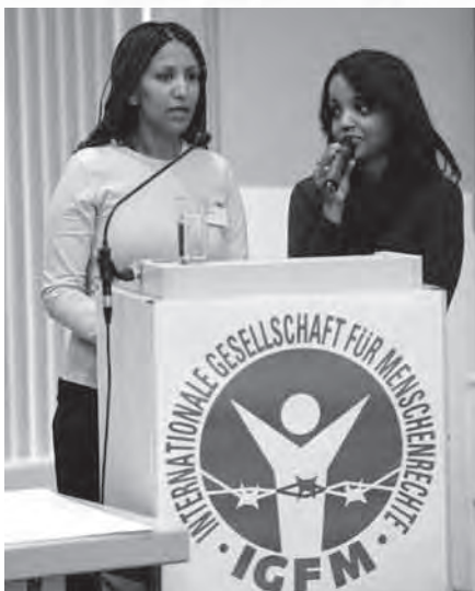
Die eritreische Gospelsängerin Helen Berhane (bei IGFM-Jahresversammlung 2009), die wegen ihres Glaubens in Eritrea 30 Monate in Folterhaft war.

Die IGFM (Internationale Gesellschaft für Menschenrechte www.igfm.de ) wird auf dem II. Ökumenischen Kirchentag vom 12. - 16. Mai 2010 in München für einen „Ökumenischen Tag der verfolgten Christen“ eintreten. □