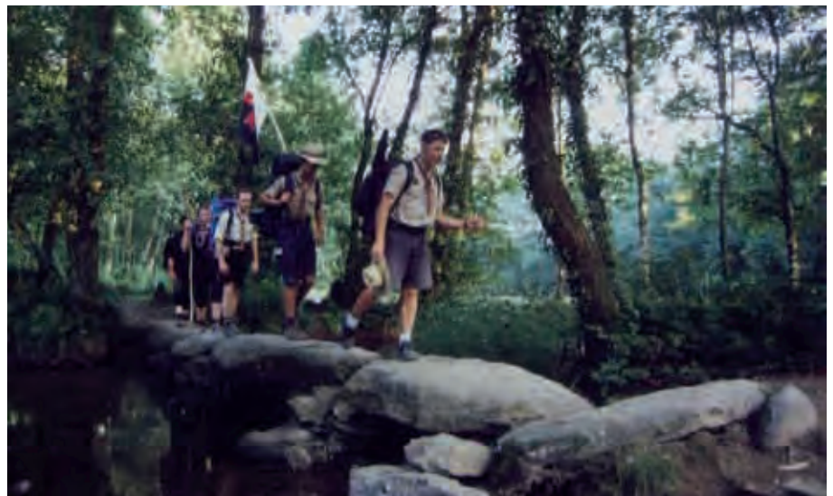
Pfadfinder auf dem Jakobsweg

Für mich ist das ein Hoffnungszeichen, denn sich auf den Weg machen ist etwas Ur-Christliches. Nichts widerspricht dem christlichen Glauben an Jesus Christus mehr als der Stillstand, das Fest-sitzen, die Bewegungslosigkeit. Es ist absolut kein Zufall, dass das öffentliche Wirken Jesu darin besteht, dass er drei Jahre lang mit ein paar von ihm berufenen Jüngern durch das Land zieht. Die Nachfolge, in die Jesus die ersten Jünger gerufen hat, muss man sich ganz konkret als permanente Wanderschaft vorstellen: hinter Jesus hergehen von Ort zu Ort, egal ob man sie gerade aufnimmt oder abweist. Jesus sagt einmal: „Die Füchse haben ihre Höhlen, die Vögel haben ihre Nester, der