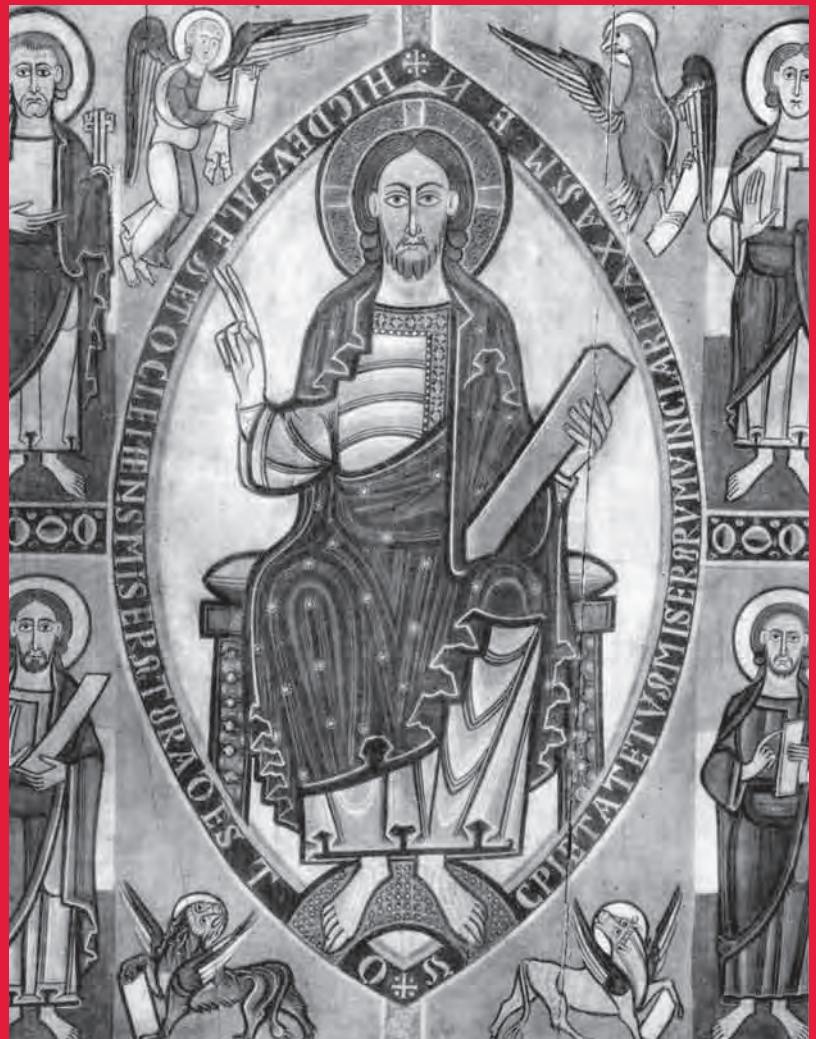
Jesus Christus, der Allherrscher, der „König der Könige und Herr der Herren“ (vgl. Offb 17,14 u. 19, 16). Katalanisch, 12. Jhdt.

„Ein Haus voll Glorie schauet – weit über alle Land – aus ew'gem Stein erbauet – von Gottes Meisterhand... .“